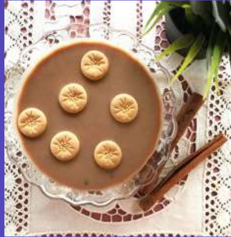
Habichuela con dulce